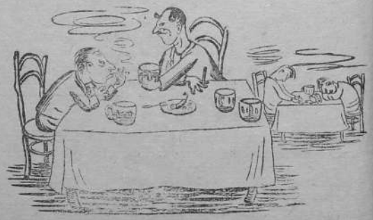
— Поздравь меня со счастливым браком! — Ты что, женился? — Да нет, бракованную продукцию сплавил! Рисунок В. Птицына.

В. КОРОБЕЙНИКОВА — инспектор горно-технической инспекции Наркомцветмета.